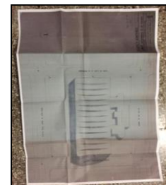
Plano de la bóveda a construir