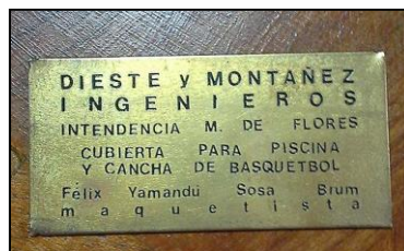
Placa que acompañaba a la maqueta que representaba la obra